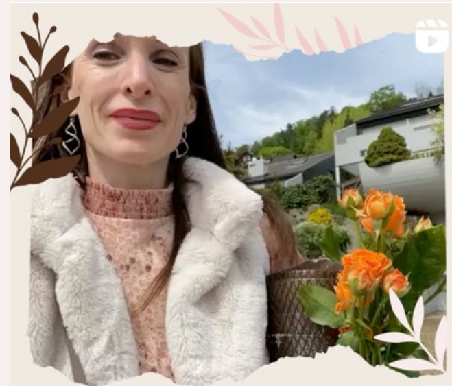
Der letzte Gang durchs Dorf